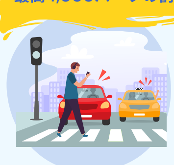
横断歩道で 一時停止しなかった場合