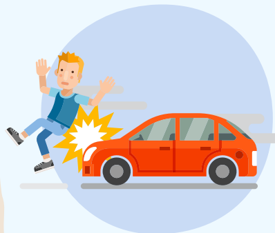
他人の安全を 考慮しない運転