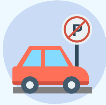
禁止区域内の駐車