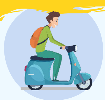
ヘルメット不着用