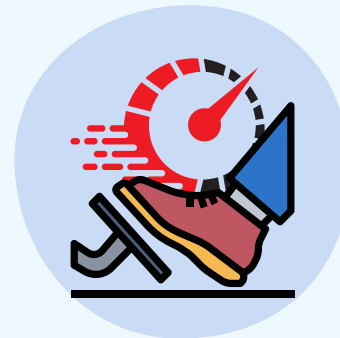
法定制限速度違反

タイ警察は 9月5日の施法から 3か月間、 従来 of 交通法に従って、 交通違反における 罰則金の適用を 発表しました。